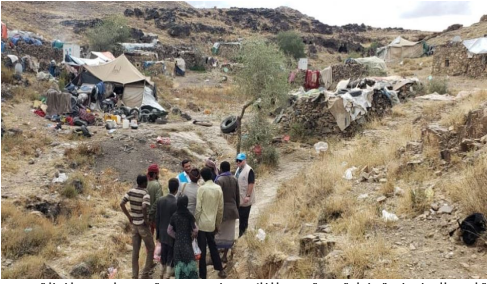
قامت المفوضية بزيارة موقعين للنازحين في مديرية همدان بمحافظة صنعاء

تستجيب المفوضية بشكل استباقي لاحتياجات الأشخاص الذين تعنى بهم الذين تعرضوا للعنف الجنسي والعنف القائم على نوع الجنس. كجزء من هذه الاستجابة، اختارت الولايات المتحدة مقترح المفوضية في اليمن حول "الوقاية من العنف الجنسي والعنف القائم على نوع الجنس وتخفيف المخاطر وتدخلات الاستجابة وتعميمها"، بوصفه واحد من ثمانية مشاريع عالمية "آمنة من البداية". المشروع الذي سيتم تنفيذه في ثلاث مديريات في محافظات حجة وعدن ولحج من المتوقع أن تستفيد منه بشكل مباشر حوالي 50,000 امرأة وفتاة و يقلل أو يخفف من حوادث العنف الجنسي والعنف القائم على نوع الجنس، مع ضمان وصول الناجين إلى آليات فعالة لتقديم الشكاوى والملاحظات. إلى جانب أنشطة أخرى، ستقوم المفوضية بتركيب أكثر من 700 وحدة إنارة في مناطق عامة في موقعين للنازحين داخلياً في مديرية عيس، محافظة حجة، باستخدام تقنية Litter of Light. يتوافق استخدام هذه التكنولوجيا المستدامة للإضاءة باستخدام الطاقة الشمسية مع الإستراتيجية العالمية للطاقة المستدامة لأربع سنوات التي أطلقتها المفوضية مؤخراً، والتي تعزز الانتقال إلى الطاقة النظيفة والمتجددة في مخيمات اللاجئين ومواقع الاستضافة، بما في ذلك فرادى الأسر والمناطق المجتمعية ومرافق الدعم. علاوة على ذلك، ستقوم المفوضية بإنشاء فريق للدوريات الليلية في المجتمعات المحلية وإعادة تأهيل مركز احتجاز النساء في مخيم خرز للاجئين في محافظة عدن، فضلاً عن توفير معدات الأمن الشخصي مثل الدراجات النارية والصفارات والمصابيح اليدوية في حي البساتين في محافظة لحج.