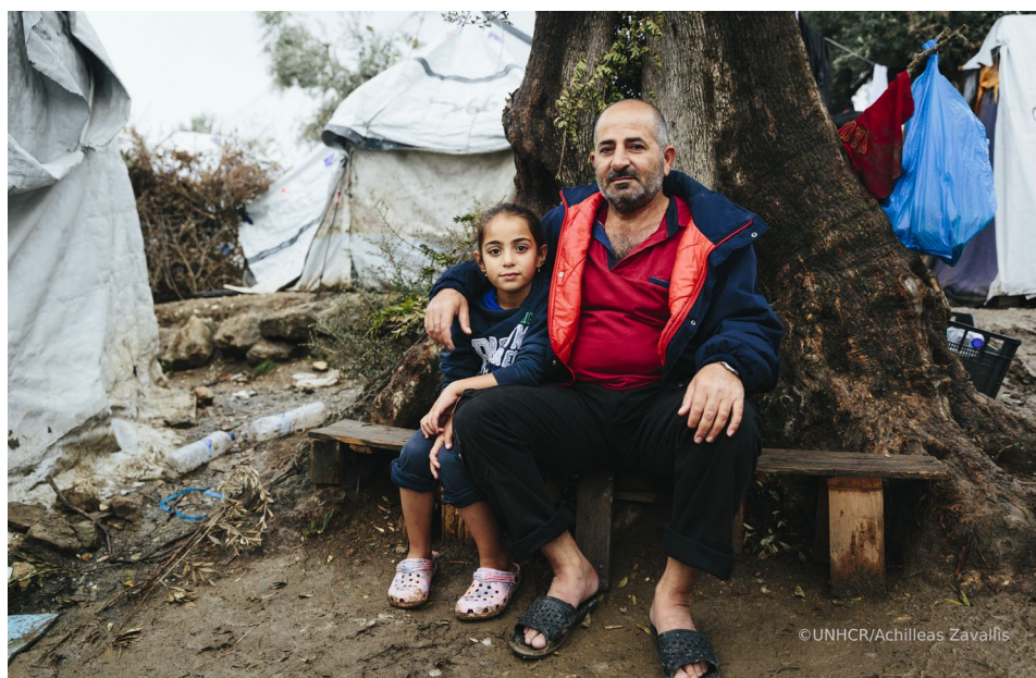
Αιτούντες άσυλο στην άτυπη επέκταση έξω από το κέντρο υποδοχής στη Μόρια, στη Λέσβο.

9 Γραφεία σε Θεσσαλονίκη, Λέσβο, Χίο, Σάμο, Κω, Έβρο, Ιωάννινα, Λέρο και Ρόδο