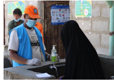
أحد العاملين يشرح لامرأة لائحة كيفية غسل اليدين، وذلك أثناء توزيع مواد النظافة مؤخراً في مخيم خرز للاجئين. تمت توعية جميع الأشخاص بشأن التباعد الاجتماعي والغسل المنتظم لليدين. © UNHCR/YPN, March 2020.

لا تزال استجابة المفوضية للنازحين داخلياً في محافظة مأرب مستمرة. من أصل 8,750 أسرة نازحة داخلياً حددتها المنظمة الدولية للهجرة في مأرب (حتى 8 أبريل)، قام شركاء المفوضية بتقييم 7,754 أسرة من الأسر النازحة داخلياً والأسر المضيفة. كانت معظم الأسر النازحة داخلياً من الأسر التي تعيّلها نساء، والكثير منهن بدون وثائق هوية تثبت هويتهن، ويتحملن مسؤولية رعاية أفراد الأسرة الذين يعانون من إعاقات وأمراض مزمنة. قامت المفوضية بتوزيع الأدوات المنزلية الأساسية مثل الفرش وأدوات المطبخ والمصابيح الشمسية على 940 أسرة نازحة داخلياً. لا تزال المناقشات جارية مع السلطات والشركاء لتسجيل النساء اللواتي ليس لديهن هوية لضمان تمكنهن من الاستفادة من خدمات الصحة العامة والتعليم.