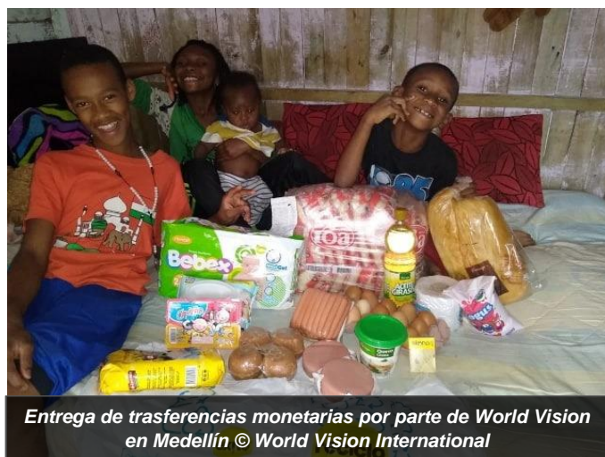
Entrega de trasferencias monetarias por parte de World Vision en Medellín