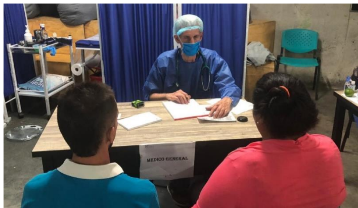
Acciones de salud en los alojamientos temporales por el programa Migración y Salud de OIM