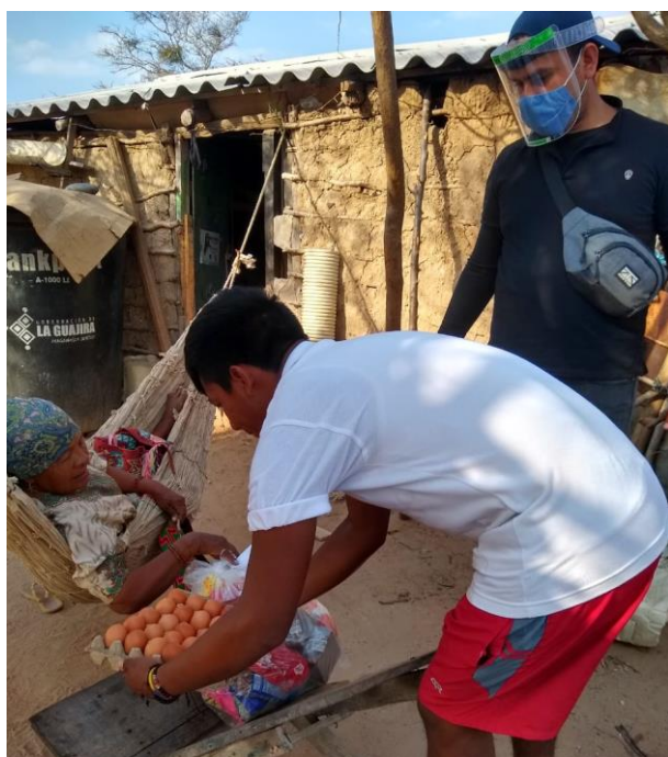
Comunidades Wayuu en Puerto Chentico, Loma Fresca y Tocoromana recibieron 288 mercados.

256 personas albergadas en la red de hoteles, 113 kits de dormida, 406 colchonetas y 90 kits de menaje en Riohacha, Maicao y Uribia.