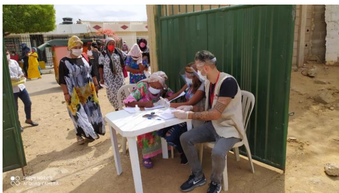
Distribución de 2.400 bonos a hogares de Uribia para la compra de alimentos e implementos de aseo durante la crisis de COVID-19 ©ZOA.

Salud: apoyo y asistencia técnica a la Secretaría de Salud, Hospitales, autoridades locales y otros puntos, en expansión de hospitales (infraestructura), gestión, dotación de equipos médicos, contratación de personal y transporte.