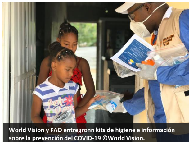
World Vision y FAO entregaron kits de higiene e información sobre la prevención del COVID-19 ©World Vision.