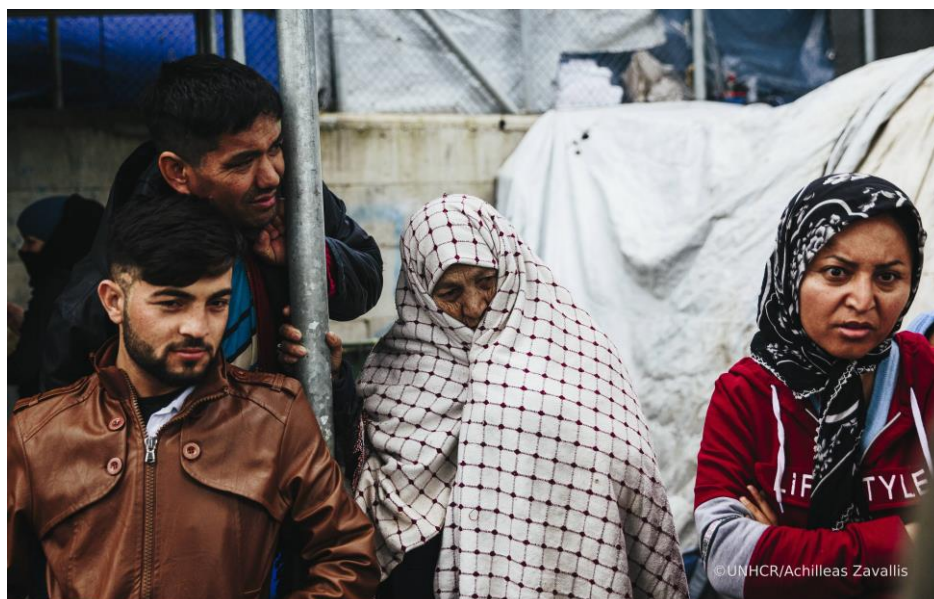
Αφγανοί αιτούντες άσυλο στο κέντρο υποδοχής στη Μόρια, στη Λέσβο.

9 Γραφεία σε Θεσσαλονίκη, Λέσβο, Χίο, Σάμο, Κω, Έβρο, Ιωάννινα, Λέρο και Ρόδο