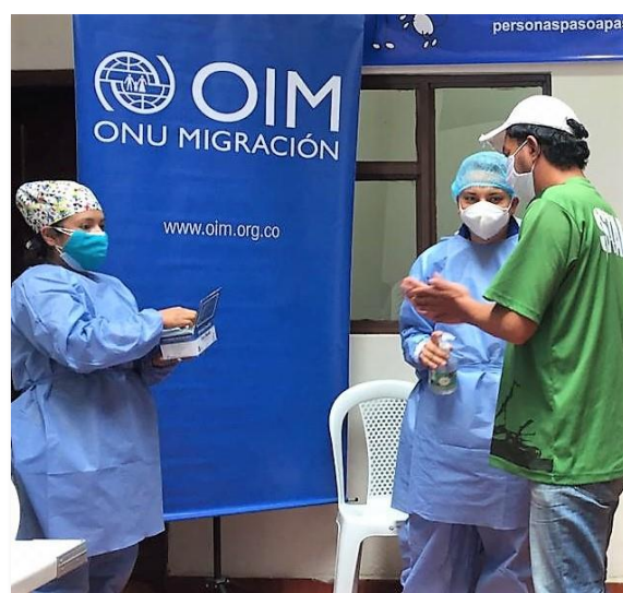
Equipamiento del personal de salud, Soacha, Ipiales, Nariño