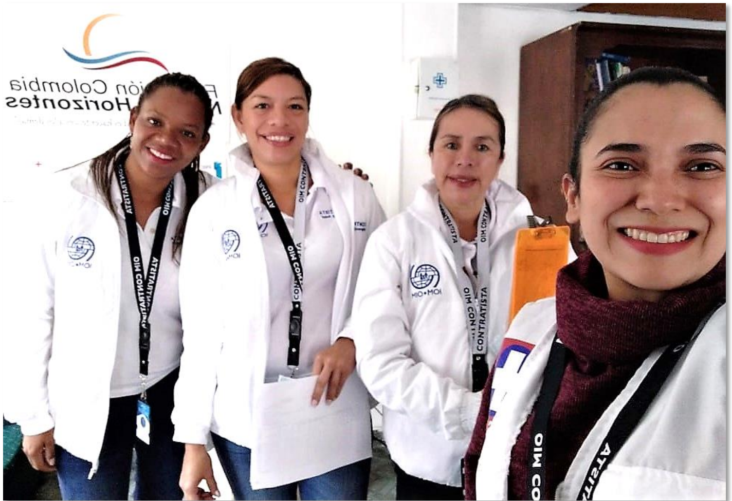
Equipo Territorial de Salud M&S- OIM, Cundinamarca