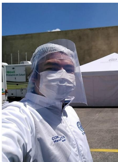
Equipamiento del personal de salud, Soacha, Cundinamarca