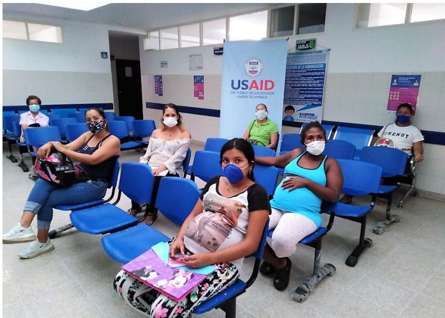
Atención prioritaria a madres gestantes con protocolo COVID-19, Villa del Rosario, Norte de Santander

Apoyo a la vigilancia activa, incluyendo exámenes de salud, derivación y recopilación de datos en POE a través de la contratación de personal de apoyo para los Centros de Regulación de Urgencia y Emergencias (CRUE) de Norte de Santander y Nariño.