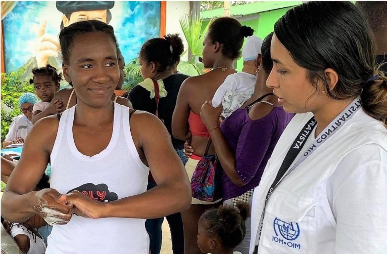
Taller lavado de Manos, Tumaco, Nariño