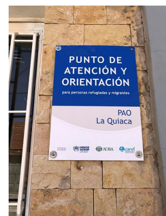
PAO en La Quiaca, Argentina, septiembre 2019.

Existen estructuras brindando información y orientación en todas las localidades visitadas en Chile y Argentina , con diferentes niveles de recursos, experiencia, información y acceso disponibles. Estas estructuras están presentes en ciudades con mayor concentración y puntos fronterizos. Algunos de estos puntos tienen pocos meses de apertura. Por ejemplo, en Argentina, ACNUR implementa junto a sus socios los Puntos de Atención y Orientación (PAO) en dos de los principales puntos fronterizos terrestres donde antes no había presencia. Otros ocho puntos de información son implementados también por la Cruz Roja Argentina con el apoyo de OIM. Importante