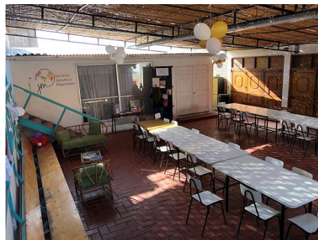
Centro de Atención Servicio Jesuita Arica, agosto 2019.

Existe la necesidad de establecer más centros comunitarios o espacios comunales para personas refugiadas, migrantes y comunidad de acogida que brinden actividades psicosociales, culturales y recreativas y fomenten la integración. Buenas prácticas se evidencian por parte de organizaciones como el Servicio Jesuita a Migrantes y Visión Mundial, entre otros.