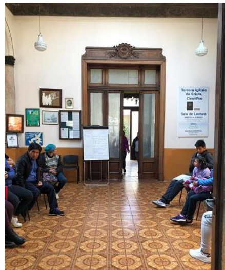
Centro de Atención de Orientación a Migrantes y Refugiados, Buenos Aires, septiembre 2019.

En Arica, se han identificado casos con necesidad de protección internacional con perfiles de personas que fueron extorsionadas en Venezuela con vacunas, casos de persecución, ex paramilitares, policías y funcionarios públicos. Algunas personas llevan dos años o más esperando la resolución del trámite de solicitud de la condición de refugiado. Muchas de estas personas ingresan por el norte de Chile donde se quedan a trabajar unos días en zonas fronterizas históricamente conocidas como ciudades de tránsito como Arica e Iquique con presencia de migrantes bolivianos, peruanos, colombianos, ecuatorianos y algunos asiáticos. Las personas refugiadas y migrantes venezolanas permanecen unos días en estas zonas fronterizas porque no tienen dinero suficiente para continuar el viaje, ahorran y siguen su trayecto hacia provincias del interior donde tienen familiares o redes de apoyo. Se estima que muy pocas, alrededor de 20%, son las personas que tienen redes o las crean y deciden quedarse a vivir en estas zonas fronterizas. En Arica, se estima que un 90% de las personas