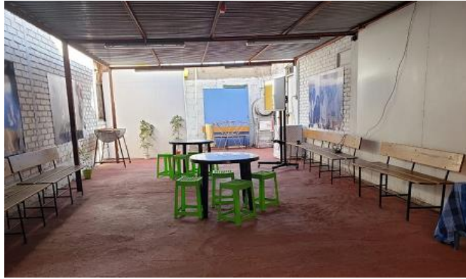
Espacio comunitario de lavandería para personas refugiadas y migrantes. Baño y ducha disponible y una sala de esparcimiento. Iniciativa organizada por la Parroquia del Carmen en Arica, agosto 2019.