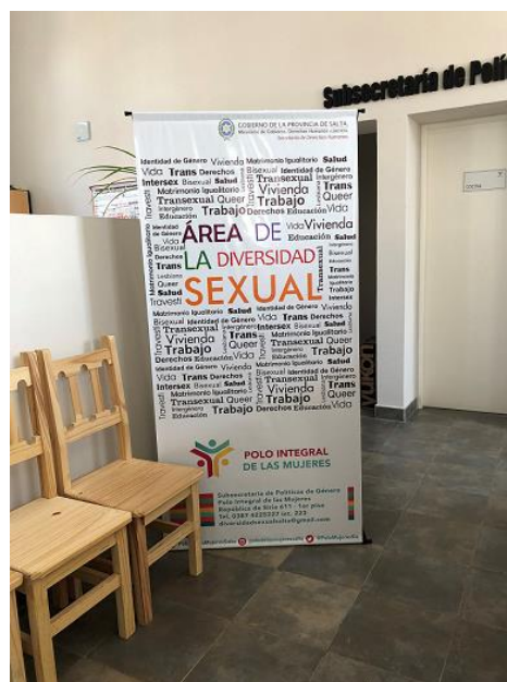
Polo Integral de las Mujeres, Salta - Argentina, septiembre 2019.

Se han reportado algunos casos de sobrevivientes de violencia basada en género y casos de personas que recurren al sexo por supervivencia a través del trabajo sexual formal e informal. En Arica se conoce que mujeres y mujeres trans venezolanas recurren al trabajo sexual, sin embargo, no hay datos exactos ni programas especializados de respuesta. Algunas mujeres trans venezolanas se quedan en Arica y el resto se desplaza a capitales. Las mujeres entre 20 y 30 años que llegan solas y por lo general dejan a sus hijos bajo el cuidado de familiares. Según relatos durante la atención a mujeres, indican que algunas amigas les ofrecieron ir a Chile a trabajar en casas de familias o restaurantes y resultaron ser lugares para el trabajo sexual donde son explotadas. Algunas de estas mujeres logran huir y piden ayuda a la iglesia/organizaciones quienes les brindan albergue y asistencia. En Iquique, donde se desarrolla el trabajo sexual son conocidos como “cafés con piernas” y night-clubs.