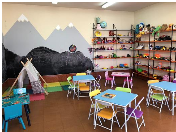
Espacio Amigable en Centro de Atención World Vision, Arica, agosto 2019.

En Argentina, el programa de Restauración de Vínculos Familiares (RFL por sus siglas en inglés) es implementado por la Cruz Roja a través de puntos de atención e información en ocho puntos donde reciben a población venezolana.