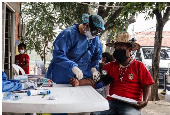
Toma de signos vitales de la comunidad yukpa en la Norte de Santander.