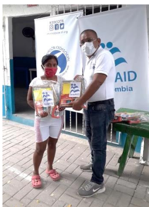
Entrega de guías y actividades educativas, y de kits educativos y cartillas para niños y niñas en Barranquilla, Atlántico.

Durante el mes de junio, más de 4.500 beneficiarios recibieron una o más asistencias a través de 11 socios e implementadores del RMRP, en 26 municipios de 11 departamentos, tanto fronterizos como de tránsito y permanencia de refugiados y migrantes. El sector de Educación continuó llevando a cabo actividades de apoyo al aprendizaje a distancia, con materiales impresos y virtuales, bajo los lineamientos de bioseguridad del Ministerio de Educación Nacional (MEN). Adicionalmente, en coordinación con el MEN, las Secretarías de Educación y los espacios de coordinación locales, en junio se adelantaron mapeos de necesidades educativas en Chocó, Arauca, Meta, Guaviare y La Guajira, los cuales ayudarán a la planeación e implementación de un plan gradual de retorno progresivo de niños, niñas y adolescentes a las instituciones educativas, en un modelo de alternancia.