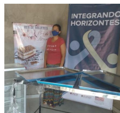
Entregas para el fortalecimiento de emprendimientos en La Guajira.

Durante el mes de junio, más de 9.300 beneficiarios recibieron una o más asistencias a través de 18 socios e implementadores del RMRP, en 17 municipios de 10 departamentos, tanto fronterizos como de permanencia de refugiados y migrantes. A lo largo del mes el sector identificó expresiones de interés de diferentes socios y donantes, en 17 de las 22 iniciativas de integración presentadas por la Gerencia para la Respuesta a la Migración desde Venezuela, lo que constituye una oportunidad para fortalecer la articulación entre la cooperación internacional y el Gobierno nacional. Respecto a la coordinación local, en junio se inauguró la Mesa de Integración Socioeconómica y Cultural de Bogotá y región, la cual articulará la respuesta a las necesidades de empleabilidad, emprendimiento e inclusión social de la población en la capital del país y sus municipios cercanos.