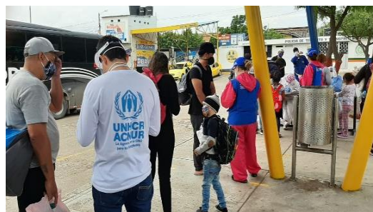
Jornada de caracterización rápida de flujos.

Durante el mes de septiembre, miembros del GIFMM han apoyado un ejercicio liderado por la Gobernación de Norte de Santander de caracterización rápida de los flujos de refugiados y migrantes en tránsito en los principales puntos de concentración, con el objetivo de identificar el perfil demográfico de la población, estatus migratorio, sus necesidades básicas más urgentes e intenciones de desplazamiento para fortalecer la articulación de la respuesta. Durante este ejercicio, se encuestaron a 348 hogares, los cuales representan 1.069 personas.