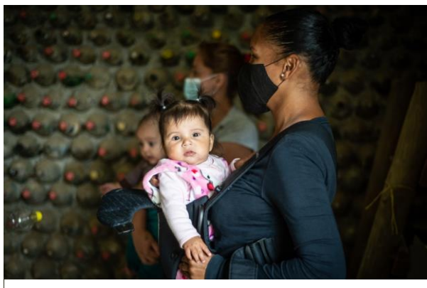
Reunión del ACNUR con un grupo de refugiadas venezolanas en Bello Oriente para abordar la prevención y mitigación de la violencia de género a través del teatro..