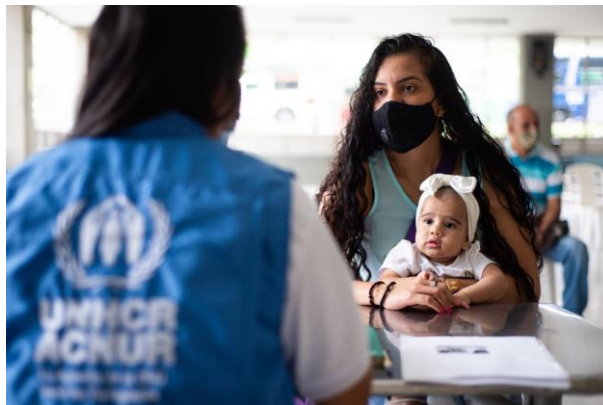
Un miembro del personal del ACNUR entrega asistencia en efectivo a las familias de refugiados venezolanos en Medellín.