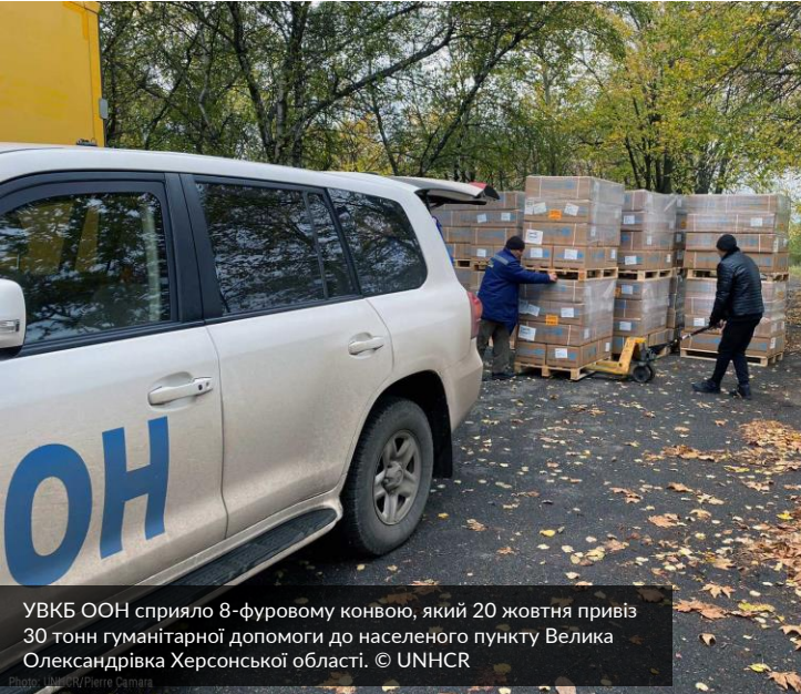
УВКБ ООН сприяло 8-фузовому конвою, який 20 жовтня привіз 30 тонн гуманітарної допомоги до населеного пункту Велика Олександрівка Херсонської області.