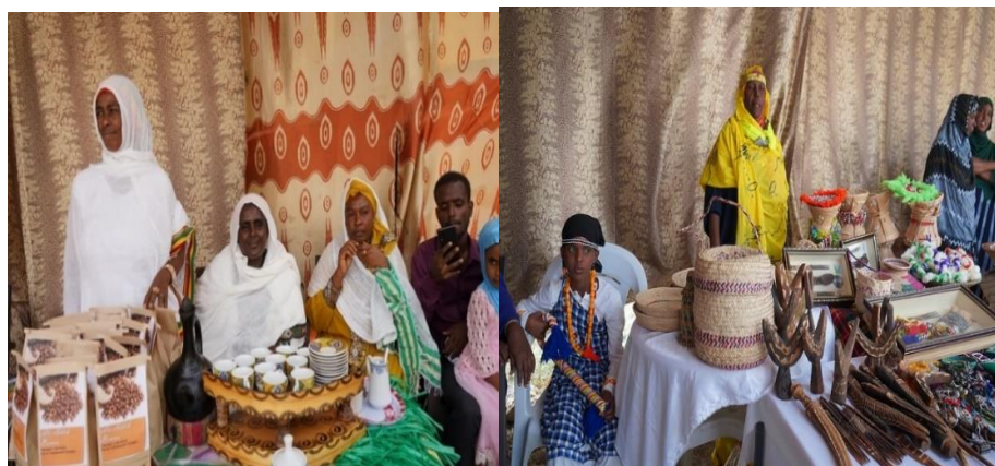
Journée mondiale des réfugiés 20 juin 2022 - les réfugiés affichent leur savoir-faire à travers l'artisanat

2 Bureaux de terrain à Ali-Sabieh et Obock