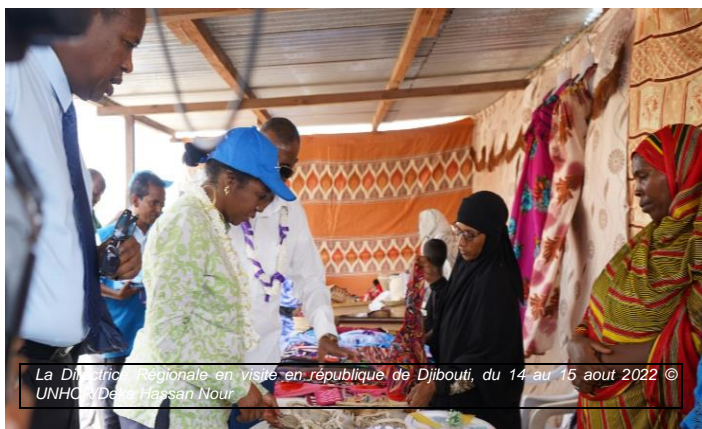
La Directrice Régionale en visite en République de Djibouti, du 14 au 15 août 2022