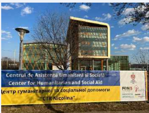
Centrul Nicolina, Iași

membre/partenere, sunt disponibili zi și noapte pentru a răspunde la o varietate de nevoi ale refugiaților printr-o abordare integrată de gestionare a cazurilor, de la cazare și mese zilnice la servicii psihosociale și terapeutice specializate, îngrijire de zi, educație non-formală pentru copii, reabilitare, mediere pentru angajare și distribuție de produse alimentare și nealimentare. Pe lângă refugiații din Ucraina, peste 1.300 de persoane cu nevoi specifice din comunitatea gazdă din Iași sunt înregistrate ca și clienți ai magazinului social, contribuind astfel la o abordare integrată și la creșterea coeziunii sociale.