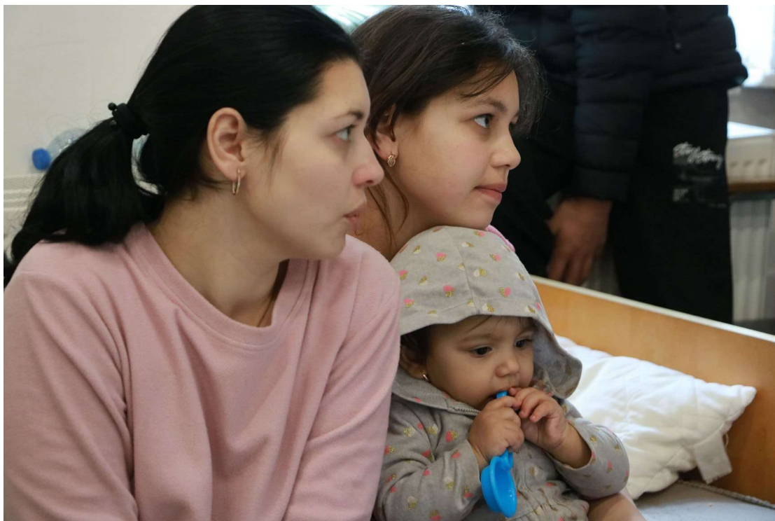
A határ menti Beregsurány kulturális központjában Ukrajnából menekülő magyar családokat látnak vendégül.

A menekült családok, különösen a nagy vagy különleges szükségletű személyeket (idős menekültek, fogyatékkal élők, terhes és szoptató nők) tartalmazó háztartások, élelmiszerhez jutását a budapesti és más megyei partnerek integrálják, különös figyelmet fordítva a kiadási szokásokra és az otthoni források elosztására. Míg a partnerek fokozatosan megszüntetik a meleg ételek biztosítását, kivéve néhány kulcsfontosságú helyszínt és a határátkelőhelyet az újonnan érkezők számára, a tápláló élelmiszerekhez való hozzáférést támogató utalványokkal vagy természetbeni adományok elosztással történő támogatása továbbra is folytatódik. Ez élelmiszer-csomagokon vagy utalványokon keresztül történik számos hozzáférési ponton keresztül, beleértve az elosztóközpontokat és az online platformokat. Ezen túlmenően, ahol az embereket közösségi lakóterekben helyezik el, ösztönöznék a konyhák használatát a kollektív terekben.