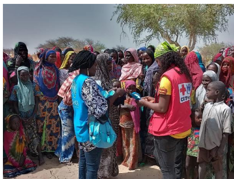
Distribution de kits de dignité aux femmes/filles déplacées internes au site de Baboul, 7 avril 2023

Plus de 1 710 personnes déplacées reçoivent des cartes d'identité dans la province du Lac. Du 4 au 6 avril, l'Agence Nationale des Titres Sécurisés (ANATS) a distribué 1 713 cartes d'identité nationales aux personnes déplacées dans les sites d'accueil de Koudou Kole et Ngorerom à Baga Sola. Cette activité fait partie des activités de prévention de l'apatridie sur lesquelles le HCR travaille avec les autorités tchadiennes.