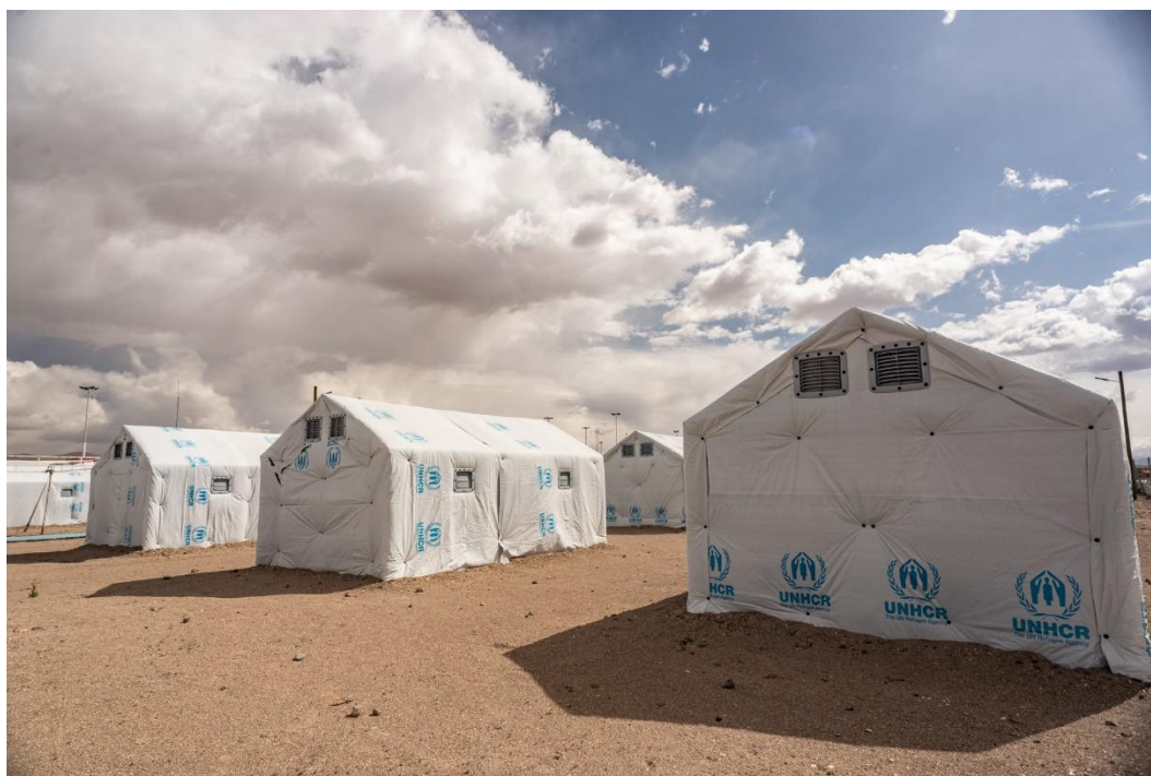
Unidades Modulares de Refugio (RHUs, por sus siglas en inglés) instaladas en Colchane, comuna fronteriza de Chile con Bolivia, Región de Tarapacá

En 2022, la llegada de miles de refugiados y migrantes a Chile, mayoritariamente en situación irregular, supuso un aumento exponencial de la xenofobia y la discriminación, donde dos de cada tres chilenos perciben negativa la llegada de extranjeros al país, y donde existe la correlación que se hace entre movilidad humana con el incremento de la inseguridad, violencia, asentamientos irregulares y la generación de contextos propicios para el ejercicio de actividades ilícitas.