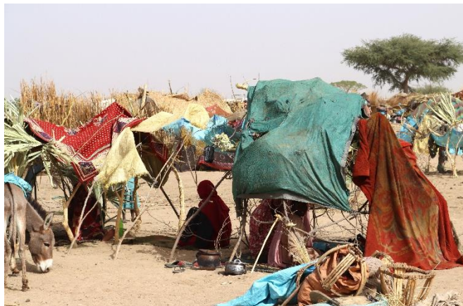
Installation d'urgence d'une famille soudanaise demanderesse d'asile, Kourfoun à 5km de la frontière soudanaise, @Aristophane Gargoune, 18 avril 2023

Entre 10 000 et 20 000 personnes fuyant les violences au Soudan trouvent refuge dans des villages à l'est du Tchad. Les affrontements entre l'armée et les forces paramilitaires des forces de soutien rapide qui ont éclaté à Khartoum avant de s'étendre à plusieurs localités de l'Est, du Centre et de la région de Darfour ont forcé des milliers de familles à fuir. Entre 10 000 et 20 000 ont traversé la frontière du Tchad et trouvé refuge dans les villages le long de la frontière au Tchad, à Borota, Kourfoun et Adre. Les nouveaux arrivants, principalement des femmes et des enfants, dorment dans des abris improvisés à l'abri des arbres. Ils ont besoin d'eau, de nourriture, de latrines, d'abris et de protection. Le HCR est à la frontière depuis le 16 avril et travaille en étroite collaboration avec la CNARR pour coordonner la réponse d'urgence.