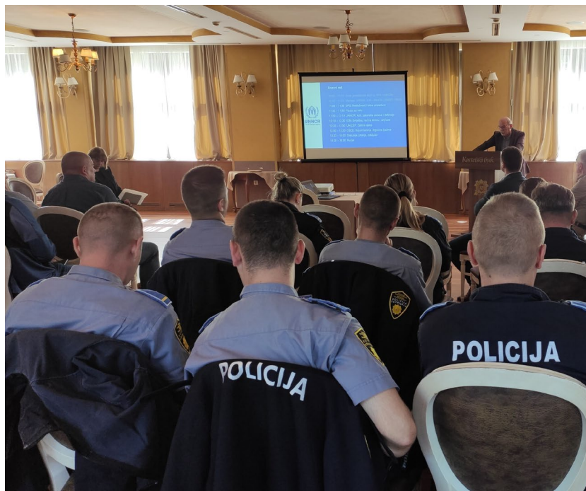
Radionica za policijske službenike u Bihaću, sa fokusom na postupak azila, zaštitu djece, krijumčarenje i trgovinu ljudima