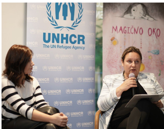
Promocija slikovnice "Magično oko" izdavačke kuće Bajkologija, 28. septembra u Sarajevu

UNHCR BiH je zahvalan na podršci svojim donatorima u 2023: Evropska Unija | Sjedinjene Američke Države