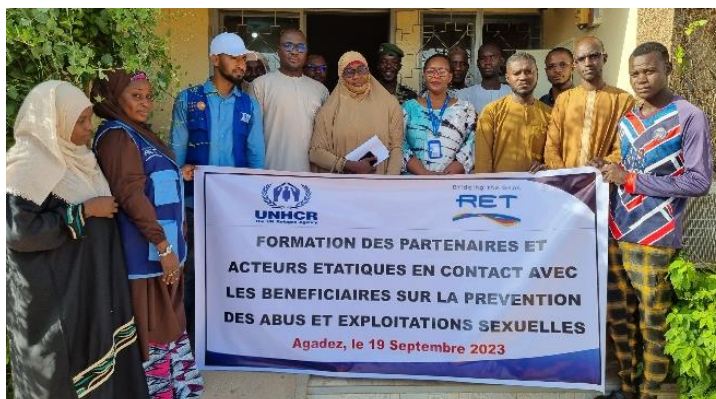
Les participant de la formation sur les PEAS posant à la fin de la formation