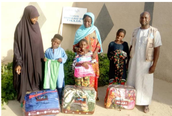
Distribution des kits de biens non alimentaires à six enfants vulnérables à Tillia

d'incidents liés à la violence basée sur le genre (VBG) et les services disponibles pour leur prise en charge.