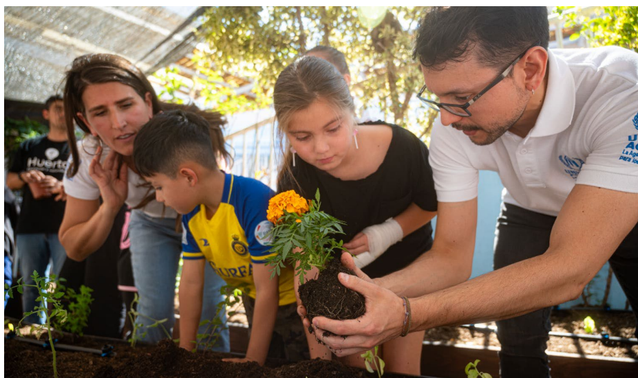
A través del proyecto "Close the Loop" ACNUR buscó promover la sostenibilidad ambiental, disminuyendo el impacto en la huella de carbono durante la implementación de sus actividades en Chile. Como cierre del proyecto, se remodeló una huerta comunitaria para promover la coexistencia pacífica entre los/as residentes de La Pintana.