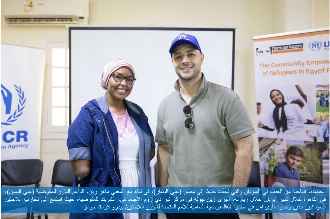
الخنساء، الناجية من العنف في السودان والتي لجأت حديثاً إلى مصر (على اليسار)، في لقاء مع المغني ماهر زين، الداعم البارز للمفوضية (على اليمين)، في القاهرة خلال شهر أبريل. خلال زيارته، أجرى زين جولة في مركز تير دي زوم الاجتماعي، الشريك للمفوضية، حيث استمع إلى تجارب اللاجئين السودانيين الذين وجدوا مأوى آمن في مصر.

الأسبوع الماضي، نظمت المفوضية بالتعاون مع شريكها تير دي زوم، برنامج تدريب لبناء القدرات استمر لمدة سبعة أيام. استهدف البرنامج عشر رابطات للتنمية المجتمعية في أسوان، مصر. شارك في البرنامج 28 ممثلاً ومتطوعاً من الرابطات المجتمعية المحلية في أسوان والمدن المجاورة مثل إدفو، كركر، ودراو. تم خلال البرنامج تقديم معلومات حول أعمال المفوضية في جنوب مصر، ومناقشة التحديات الرئيسية التي يواجهها اللاجئون السودانيون الجدد والحلول المقترحة لها. تناولت الدورات التدريبية مجموعة من الموضوعات الهامة، بما في ذلك تبادل المعلومات، الحماية، منع الاستغلال والاعتداء الجنسي، الحماية الدولية للاجئين، ومهارات التيسير، بين غيرها من الموضوعات. بعد انتهاء البرنامج التدريبي، سيقوم الممثلون والمتطوعون من رابطات التنمية المجتمعية بتقديم جلسات معلوماتية لطالبي اللجوء الجدد والذين يعيشون في مجتمعاتهم.