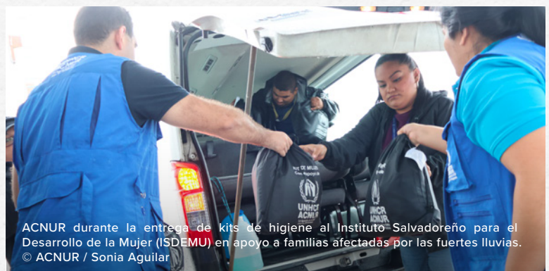
ACNUR durante la entrega de kits de higiene al Instituto Salvadoreño para el Desarrollo de la Mujer (ISDEMU) en apoyo a familias afectadas por las fuertes lluvias.