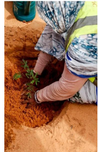
Chef des volontaires réfugiés nettoyant le camp, plantant un arbre.

Dans ce contexte, le HCR joue un rôle crucial en soutenant les efforts du gouvernement mauritanien, des agences sœurs des Nations unies, des acteurs du développement, des donateurs, des réfugiés eux-mêmes et d'autres partenaires tels que l'Alliance sahel, en pleine conformité avec la Stratégie intégrée des Nations unies pour le Sahel et la Vision intégrée des Nations Unies pour une action conjointe dans la région du Hodh Chargui, afin d'assurer une plus grande inclusion socio-économique des réfugiés et des demandeurs d'asile dans les systèmes nationaux de prestation de services (voir l'annexe 1). En outre, dans le cadre de cet objectif et pour faciliter une transition progressive d'une réponse humanitaire à l'inclusion progressive des réfugiés , le HCR travaille avec des partenaires pour assurer la transparence dans la gestion des projets de développement intégrés dans les zones d'accueil des réfugiés.