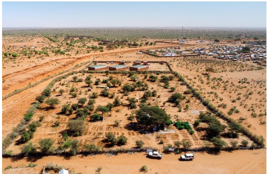
Maraichage dans le camp de Mbera