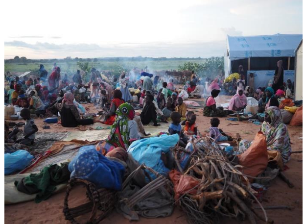
De nouveaux réfugiés Soudanais arrivant à la frontière à Adré, à l'est du Tchad.

Depuis, le 30 septembre les combats qui ont font rage à Kulbus forcent des centaines de personnes à fuir . Entre le 30 septembre et le 1 er octobre, plus de 1 400 arrivées supplémentaires ont déjà été signalées à Birak, où des blessés ont été admis au centre de santé.