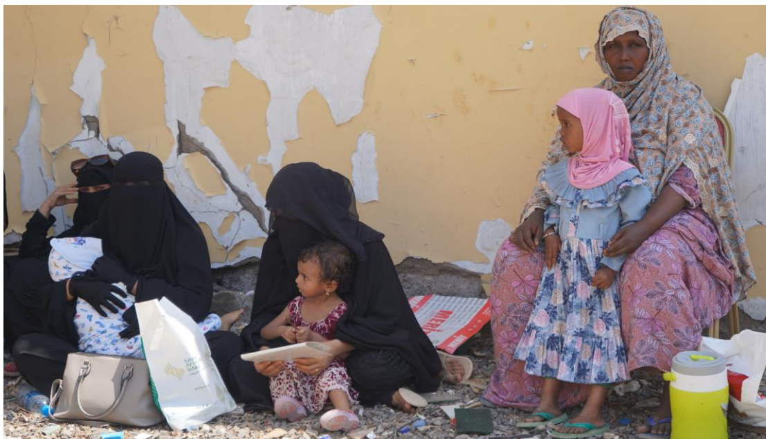
Des femmes réfugiées avec leurs enfants à Djibouti-ville attendant de recevoir l'assistance.