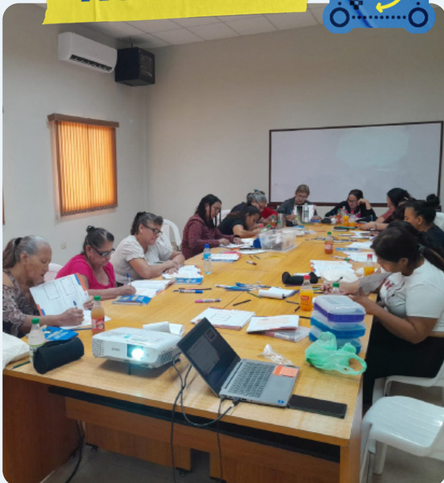
Participantes del programa Súper Pilas en Metapán, Santa Ana, participan en sesiones para elaborar planes de vida.

La cuarta cohorte del programa Súper Pilas en 2024 inició con 165 participantes, entre ellos 60 mujeres referidas por el Instituto Salvadoreño para el Desarrollo de la Mujer (ISDEMU) y financiadas por la plataforma de apoyo MIRPS. En lo que va del año, ACNUR ha fortalecido las capacidades de autoempleo y emprendimiento de 261 personas y tiene como objetivo proporcionar capital semilla a al menos 100 participantes para finales de año, promoviendo proyectos empresariales que impulsen la autosuficiencia.