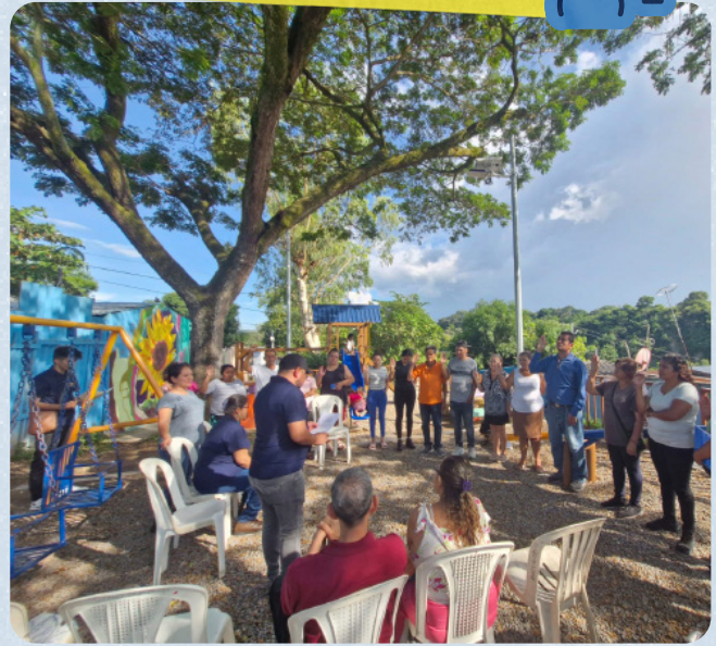
Habitantes de la comunidad de La Campanera votando para elegir a su directiva comunal.