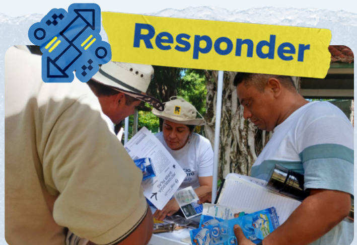
En Puerto El Triunfo (departamento de Usulután) la unidad móvil del Espacio de Apoyo "A Tu Lado" de ACNUR entregó información sobre derechos y servicios.