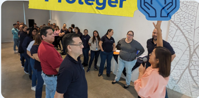
Miembros del personal de GAMI participando en una dinámica grupal durante un taller sobre inteligencia emocional.

Treinta y cinco miembros del personal del centro de recepción de personas retornadas GAMI, mejoraron sus conocimientos de inteligencia emocional y primeros auxilios psicológicos a través de un taller facilitado por ACNUR y World Vision. Participantes de la Dirección General de Migración y Extranjería (DGME), la Dirección de Atención a Víctimas (DAV), el Consejo Nacional de la Niñez y la Adolescencia (CONAPINA) y el Instituto Salvadoreño para el Desarrollo de la Mujer (ISDEMU), conocieron sobre vías de derivación y servicios disponibles para personas con necesidades específicas.