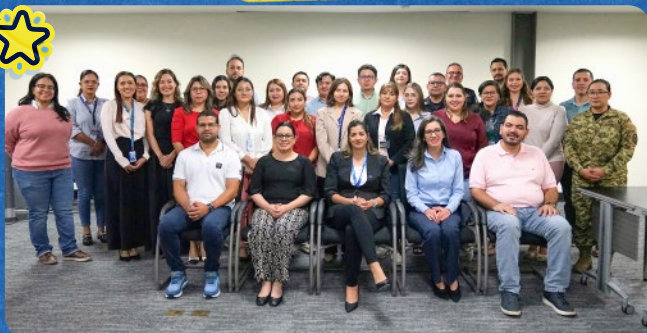
Participantes del diplomado en Protección Internacional durante la sesión inaugural en el Instituto Diplomático.