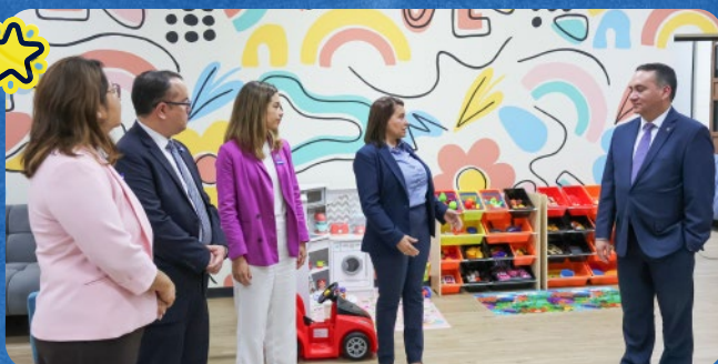
La Representante a.i. del ACNUR junto al Fiscal General durante la inauguración de un nuevo espacio de atención a víctimas en La Libertad.

En colaboración con el Instituto Diplomático "Dr. José Gustavo Guerrero" y la Comisión para la Determinación de la Condición de Personas Refugiadas (CODER), ACNUR lanzó un Diplomado en Protección Internacional para 35 miembros del personal de la CODER, ONGs y academia. Este programa de fortalecimiento de capacidades, con una duración de cuatro meses, mejora las competencias para identificar a personas con necesidades de protección internacional y fortalece el acceso al asilo.