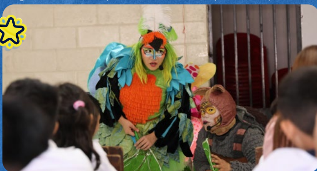
Niñas y niños de la comunidad Tutunichapa en San Salvador interactúan durante la presentación de "La Travesía de Gualcho".