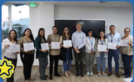
Puntos focales de albergues durante la sesión de clausura de los talleres del ACNUR sobre gestión de albergues de protección.