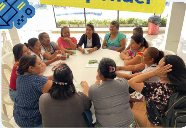
Mujeres de varias regiones dialogan sobre los retos y soluciones en sus comunidades durante un conversatorio organizado por ACNUR.