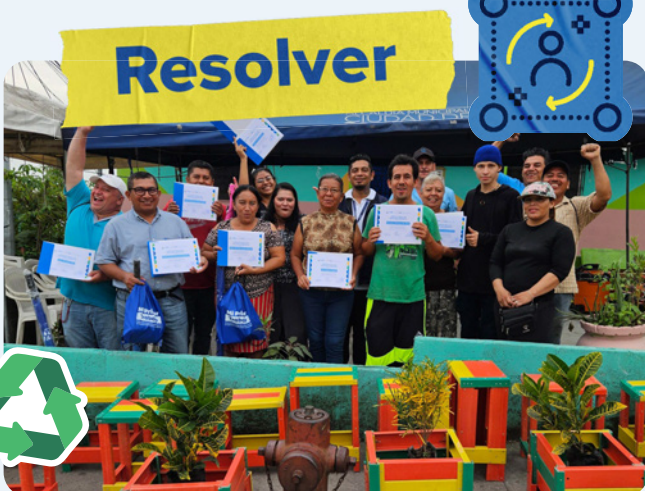
Residentes de la comunidad de La Campanera muestran los productos de fibra de vidrio reciclada creados gracias a la capacitación impartida con el apoyo del ACNUR.