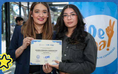
La Directora del CIIE entregando certificados a graduados de Psico-Apoyarte.