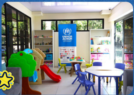
Las nuevas instalaciones del CODER inauguradas con el apoyo del ACNUR en San Salvador.