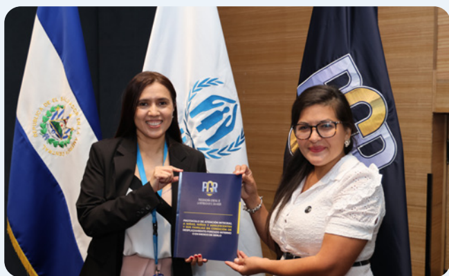
Personal de la PGR durante las sesiones informativas sobre el nuevo protocolo para la protección de niñas, niños y adolescentes desplazados desarrollado con el apoyo del ACNUR.