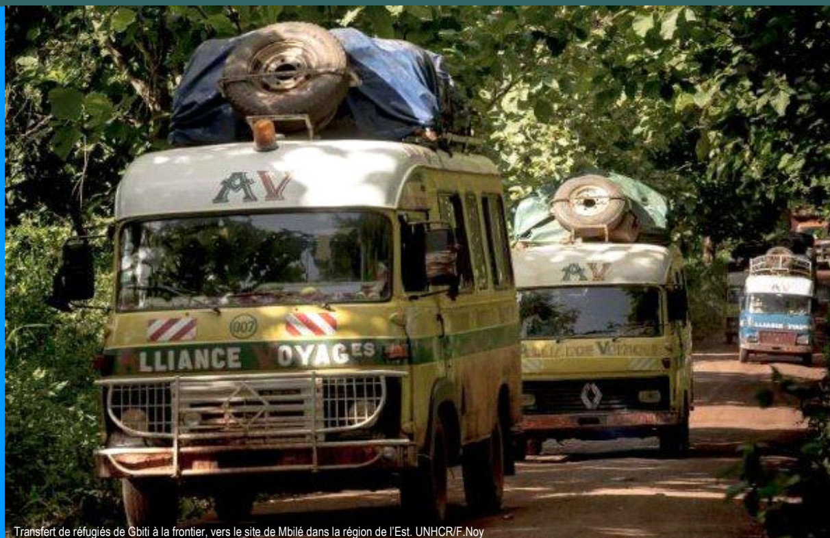
Transfert de réfugiés de Gbiti à la frontière, vers le site de Mbilé dans la région de l'Est.