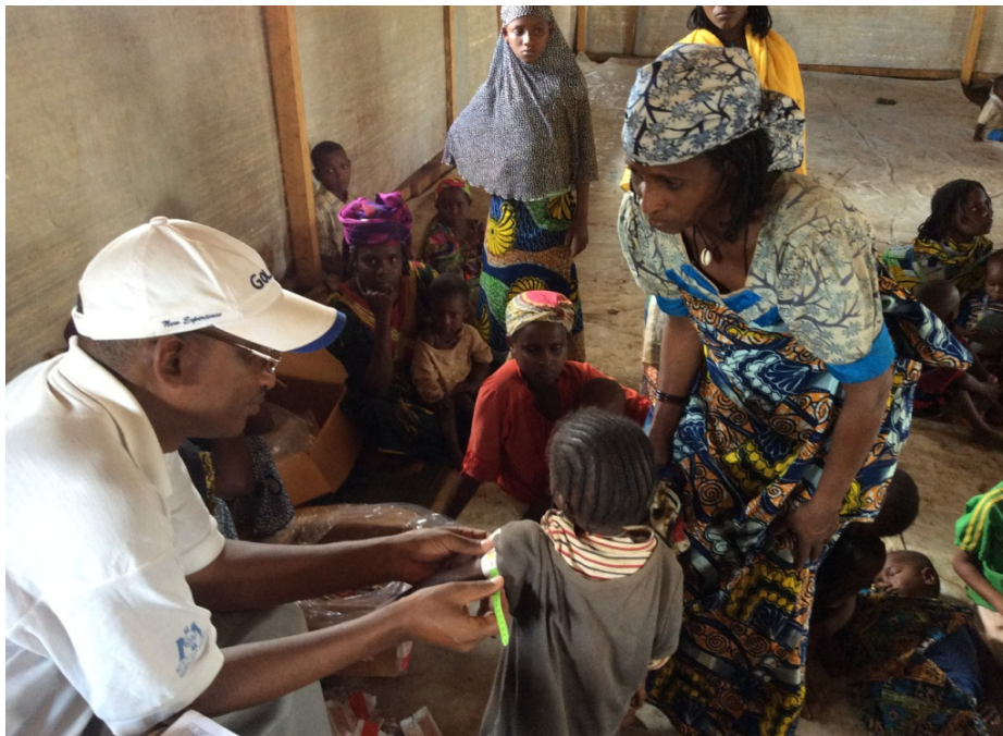
Dépistage de la malnutrition chez les enfants de moins de 5 ans, les femmes enceintes et allaitantes sur le site de Borgop.