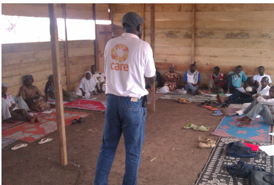
Formation sur les premiers soins psychologiques fournie par CARE aux animateurs des espaces amis d'enfants.