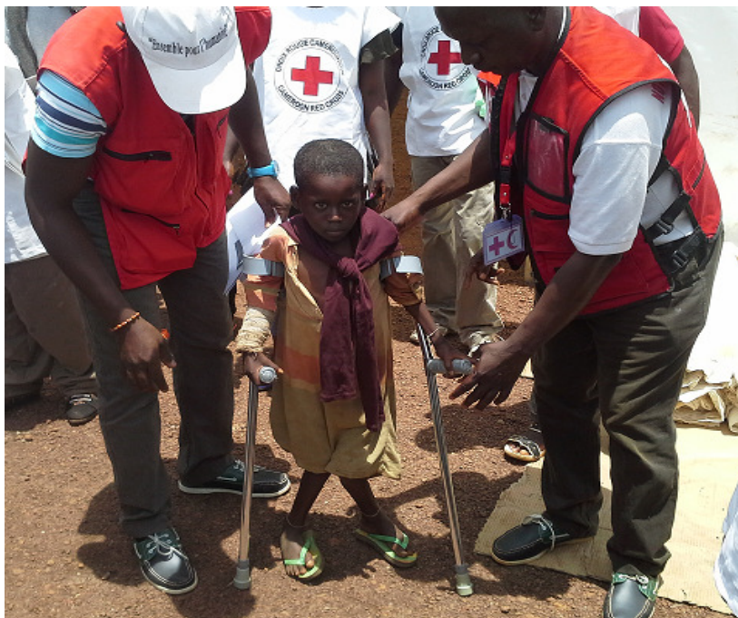
Remise de béquilles à un enfant non accompagné du site de Lolo.