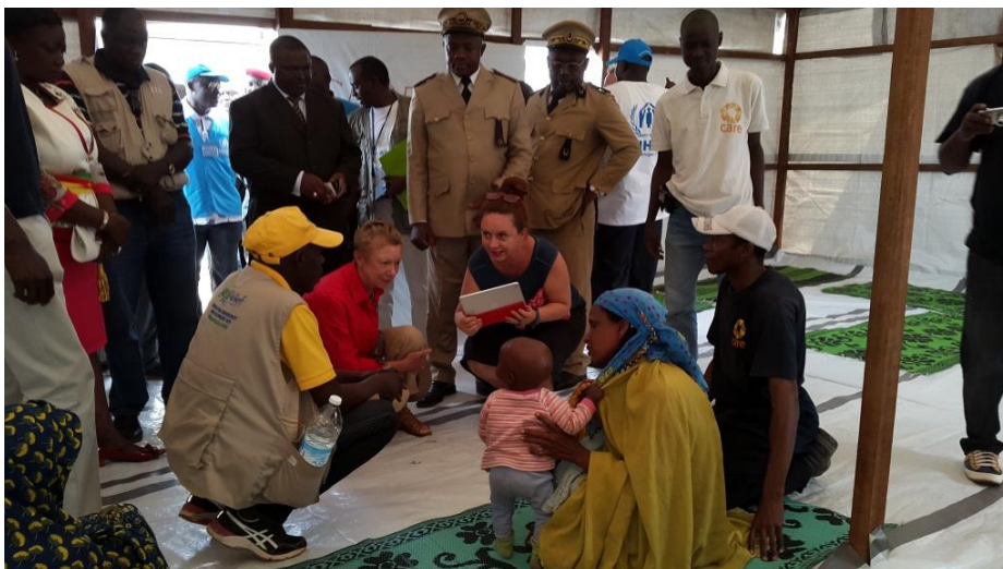
Madame l'Ambassadrice de France s'entretenant avec une réfugiée au centre de soutien psychosocial de CARE, partenaire du HCR, sur le site de Gado.