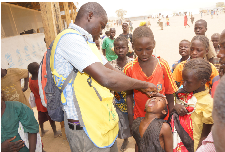
Vaccination contre la polio par les équipes de vaccinateurs de l'UNICEF dans les sites réfugiés.