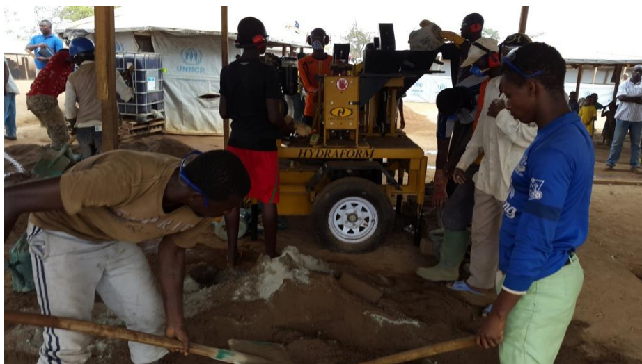
Formation des réfugiés et population hôte sur la fabrication de briques à l'aide des machines Hydraform sur le site de Gado.