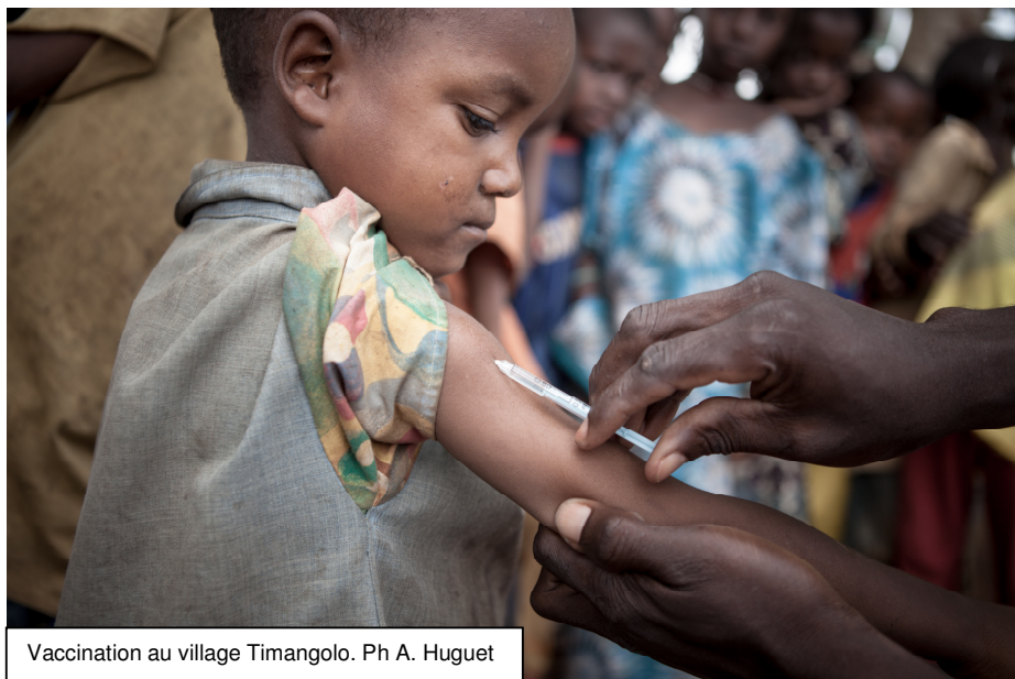
Vaccination au village Timangolo.