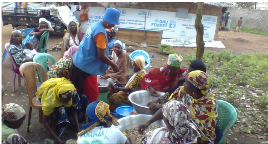
Renforcement des capacités des femmes survivantes de VBG et autres sur l'autonomisation économique.