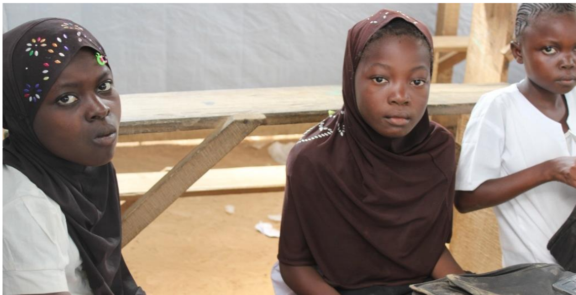
Elèves réfugiées musulmanes qui étudient hors camp à Zongo.

En 2016, le montant total demandé pour aider les réfugiés centrafricains dans les régions du Nord Ubangi, Sud Ubangi et Bas Uélé s'élève à $57.015.453 .