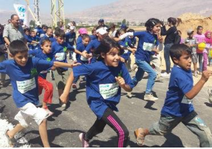
أطفال سوريون لاجئون في أحد تجمعات سهل البقاع، لبنان، يشاركون في سباق لإطلاق أسبوع التلقيح.