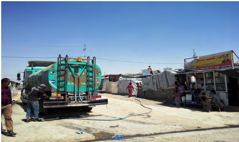
إيصال المياه الى مخيم دوميذ ٢ - المفوضية