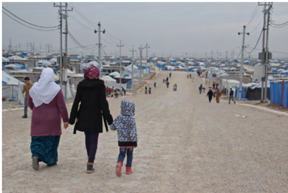
تقديم المساعدة الى الوافدين الجدد من سوريا عبر نقطة فيشخابور الحدودية وتسجيلهم في مخيم غاويلان للاجئين، محافظة نينوى - المفوضية