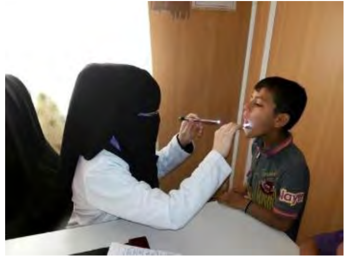
العيادة الصحية في مخيم العبيدي - الجمعية الطبية العراقية الموحدة

■ جرى فحص ألف و338 طفلاً دون سن الخامسة في مخيمات اللاجئين في اقليم كردستان العراق ضمن برنامج كوخ الاطفال الذي تدعمه اليونيسيف. وتواصلت مشاركة المعلومات والاستشارات بشأن قضايا الامومة وصحة الطفل، حيث نظمت 110 ندوة في مخيمات اللاجئين خلال فترة إعداد التقرير لتصل الى 790 امرأة حامل والامهات الجدد، حيث قدمت لهن المعلومات عن تغذية الطفل الرضيع والصغير.