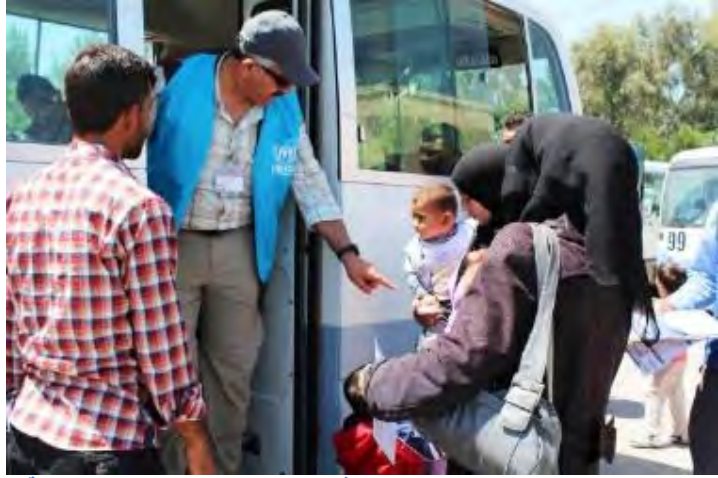
طالبو لجوء سوريون على وشك نقلهم من فيشخابور إلى مخيم كاويلان

فيشخابور، إقليم كردستان العراق، 18 أيار 2015 (المفوضية السامية للأمم المتحدة لشؤون اللاجئين) - تعتبر نقطة فيشخابور الحدودية، التي تفتح كل يوم اثنين لطالبي اللجوء من السوريين، جسراً للسلامة بالنسبة للسوريين الفارين إلى إقليم كردستان العراق والذين هم في حاجة إلى الحماية الدولية. ويكون يوم الاثنين عادياً إذا ما شهد دخول نحو 150 سورياً عبر هذا المنفذ الحدودي.