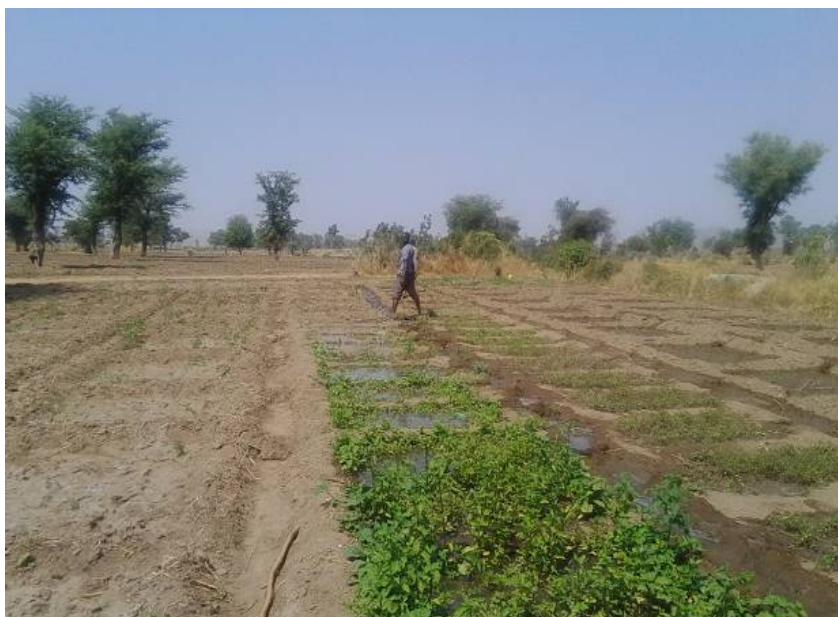
L'irrigation des parcelles par les réfugiés à Minawao.