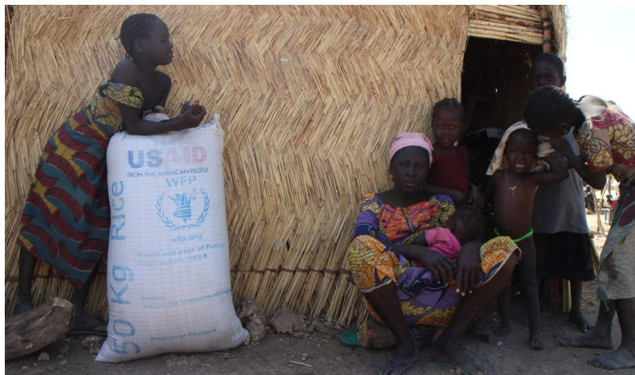
Une famille réfugiée au camp de Minawao. Le PAM fournit des vivres pour des distributions en faveur de tous les réfugiés au camp ainsi que les nouveaux arrivés. USAID est le plus grand donateur aux opérations de PAM.