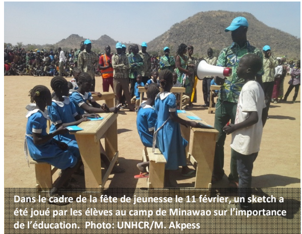
Dans le cadre de la fête de jeunesse le 11 février, un sketch a été joué par les élèves au camp de Minawao sur l'importance de l'éducation.