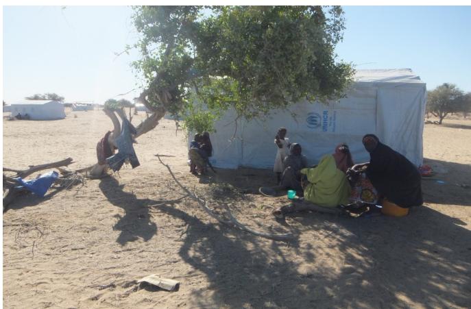
Abris familial dans le site de Dar Es Salam; Jan 2015.