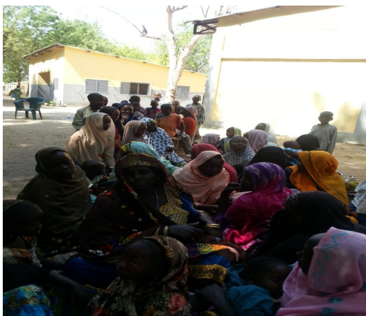
Réfugiés Camerounais et Nigérien de Moulkou; feb 15