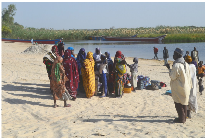
L' Arrivée des réfugiés Nigérianes de Kngalòm; février 15