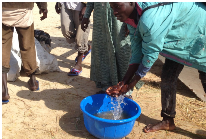
Réfugiés relocalisés suivent les mesures systématique d'hygiène préventive à dès leur arrivée à Bagasola. Fev 15, photo: Farman/UNHCR