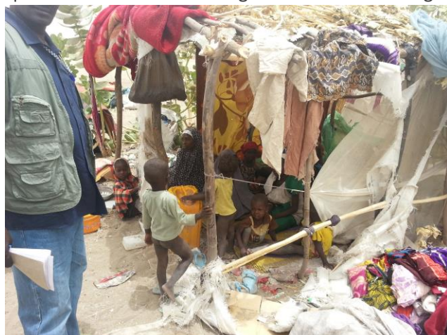
Réfugiés a Hakoui Tchilouma

Plus de 500 réfugiés nigériens ont été repérés à Hakoui Tchilouma par les différentes missions inter agences effectuées dans la zone, en date du 3, 7 et 8 Mai 2015. La moitié de ces réfugiés n'ont pas voulu regagner le camp de Dar Es Salam malgré le transport fourni par le HCR, préférant rester au bord du lac pour continuer leurs activités de pêche