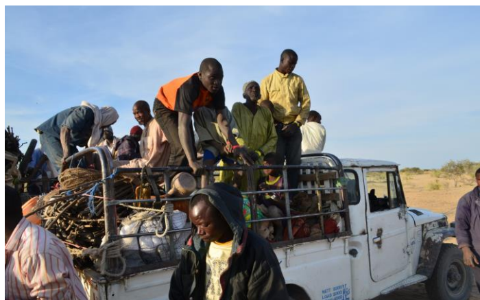
Réfugiés Nigériens en provenance de Kaiga Kindiria au site de Dar Es Salam. Mai 2015