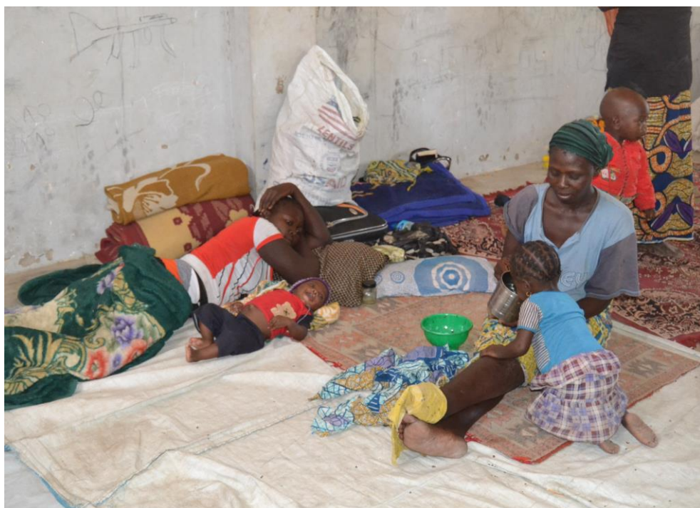
Retournées tchadiennes fuyant des exactions au Nigeria a Bagasola @UNHCR/BSantos

Map Sources: UNCS, UNHCR. The boundaries and names shown on this map do not imply official endorsement or acceptance by the United Nations. Final boundary between the Republic of Sudan and the Republic of South Sudan has not yet been determined. Creation date: 21 May 2015.