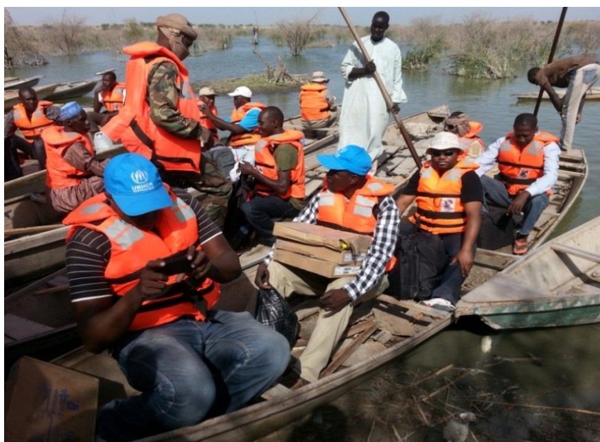
Mission humanitaire vers les zones insulaires @HCR/juin

Map Sources: UNCS, UNHCR. The boundaries and names shown and the designations used on this map do not imply official endorsement or acceptance by the United Nations. Final boundary between the Republic of Sudan and the Republic of South Sudan has not yet been determined. Creation date: 21 May 2015.